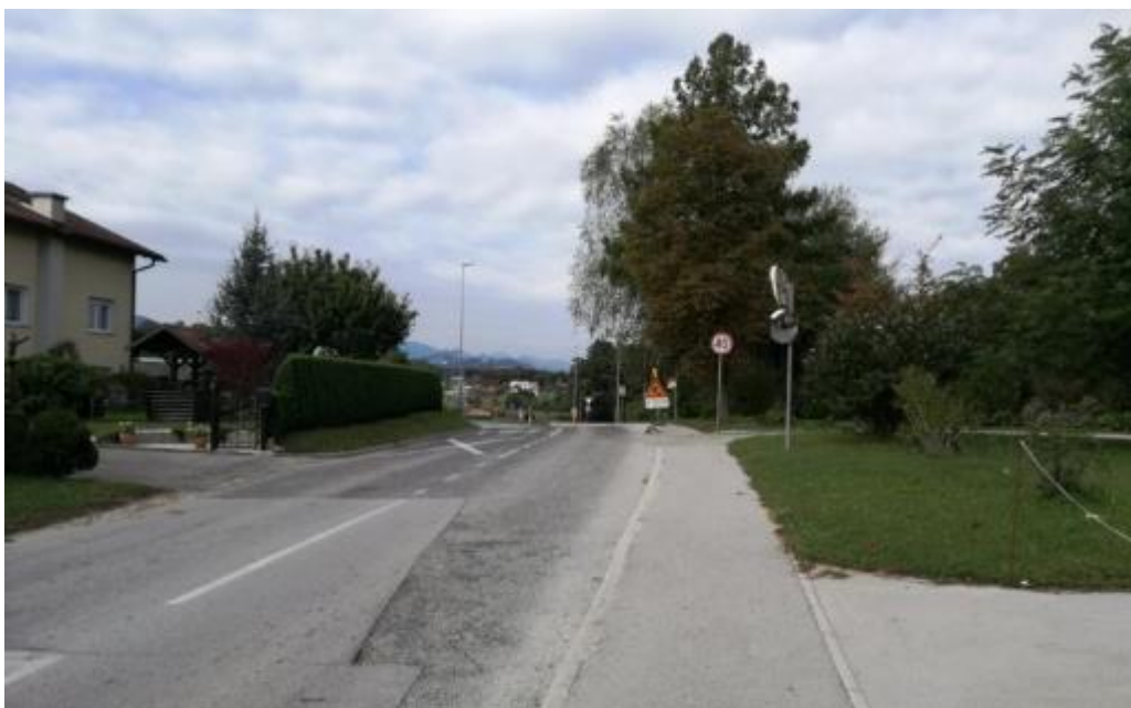
Slika 15: Cesta skozi Proseniško