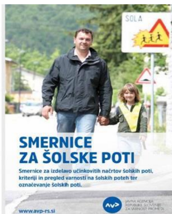
Slika 7: Smernice za šolske poti