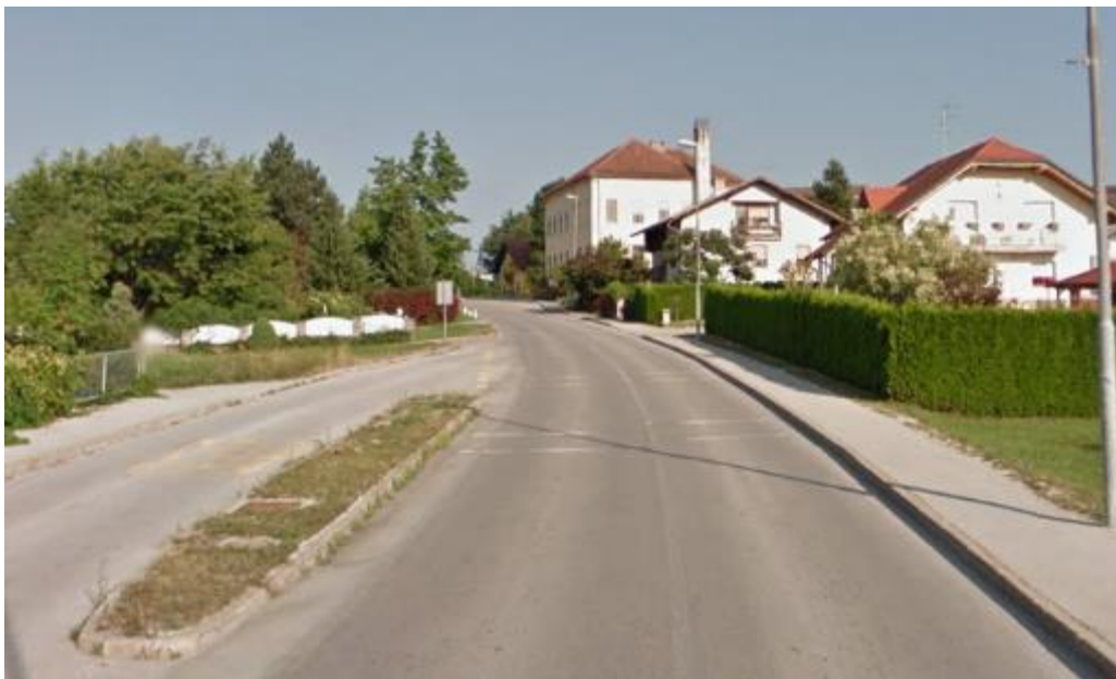
Slika 26: Urejene površine za pešce na cesti skozi Proseniško

V primeru, da pri hoji naletimo na občestno oviro, se vedno dobro prepričamo, da jo lahko varno zaobidemo. Pri vsakem prečkanju ceste se prepričamo, da v bližini ni nobenih vozil oziroma so nam vozila ustavila, tako da lahko varno prečkamo cesto.