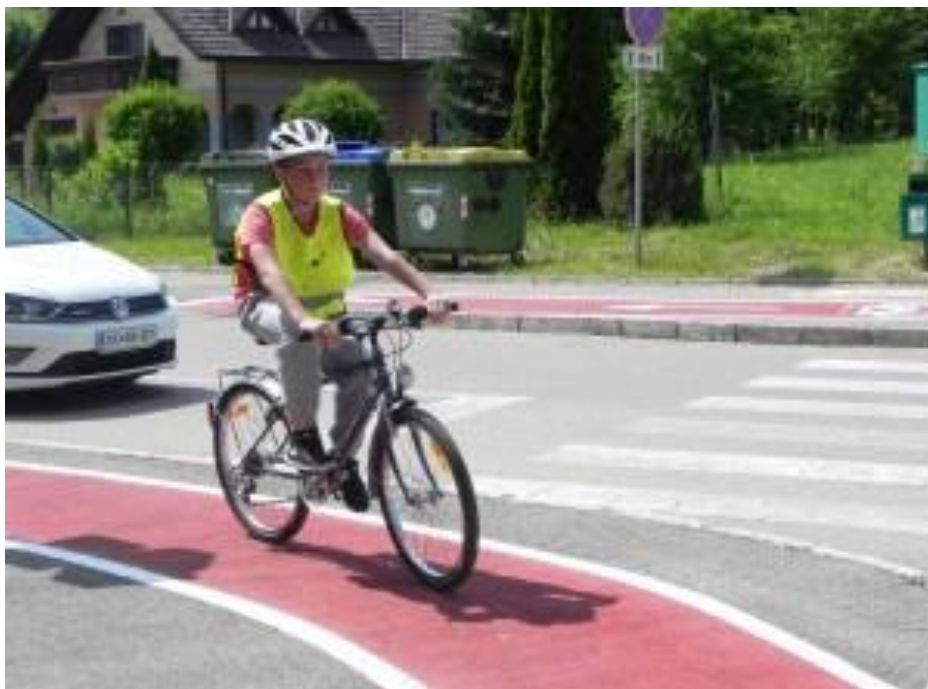
Slika 9: Šolar-kolesar