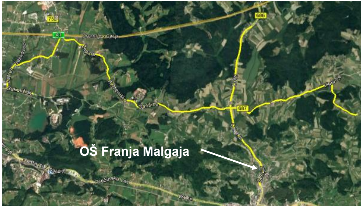
Slika 29: Linije šolskega prevoza

Tretjina vseh šolskih otrok v šolo prihaja s šolskim prevozom. Šolarji vozači prihajajo iz naselij Goričica, Hotunje, Proseniško, Primož, Lokarje, Dol, Vrbno in Prožinska vas. Omenjena naselja so razpršena znotraj širšega šolskega okoliša. V naseljih je veliko cest izvedenih brez hodnikov za pešce, v večini primerov pa so avtobusna postajališča urejena.