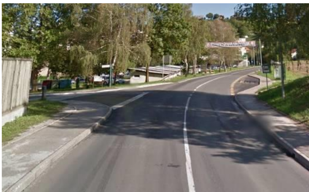
Slika 12: Križišče ceste Miloša Zidanška in ceste Na Lipico