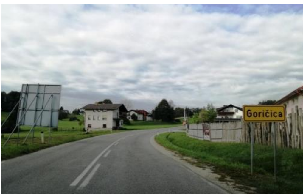
Slika 14: Cesta skozi Goričico