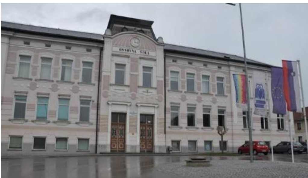
Slika 1: OŠ Franja Malgaja Šentjur

Vsaka šola naj bi imela izdelan načrt šolskih poti s katerim seznanijo vse učence in njihove starše. Načrt je prvenstveno namenjen večji varnosti šolarjev v cestnem prometu. Znotraj načrta šolskih poti, ki je zasnovan v skladu s Smernicami za šolske poti, katere je izdala Javna agencija RS za varnost prometa, smo opravili pregled stanja šolskih poti in šolskega okoliša, prav tako smo izdelali tudi analizo prometne varnosti na območju obravnavanih šolskih poti. Med učenci in njihovimi starši oziroma skrbniki smo izvedli tudi anketo v kateri smo poizvedovali o tem, kje in na kakšen način otroci prihajajo v šolo, kje se srečujejo z nevarnimi mesti in težavami na poti v šolo ter kaj jih po njihovem mnenju na poti v šolo najbolj ogroža. Učencem in njihovim staršem je tako omogočeno, da lahko podajo svoj pogled in predloge za reševanje prometne problematike ter za izboljšanje prometne varnosti na obravnavanem območju.