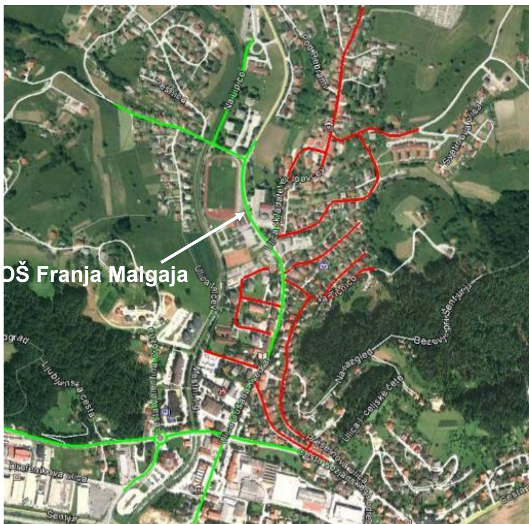
Slika 17: Prikaz šolskih poti OŠ Franja Malgaja Šentjur

Šolarji OŠ Franja Malgaja se na poti v šolo srečujejo tako z urejenimi odseki, kot tudi z odseki, kjer infrastruktura namenjena prometu pešcev ni urejena. Urejene površine za pešce lahko tako najdemo na delu Ulice skladateljev Ipavcev, cesti Miloša Zidanška, ulici Dušana Kvedra, ulici Na Lipico, Ljubljanski cesti, Cesti Kozjanskega odreda,.. Na preostalih, predvsem manj prometnih cestah in ulicah, površine za pešce niso izvedene.