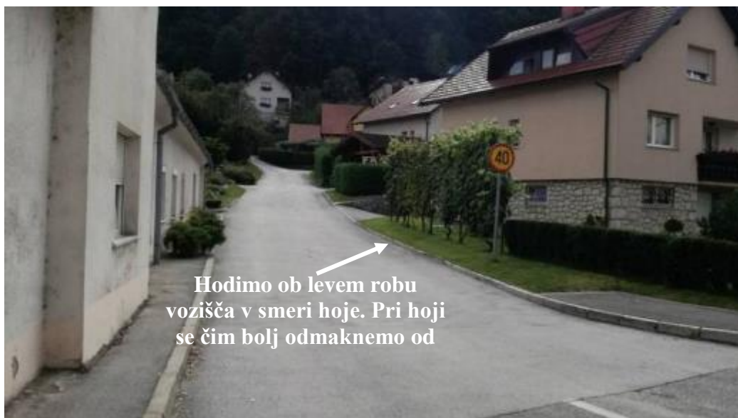
Slika 22: Neurejene površine za pešce na ulici Na Tičnico

Hodimo po pločniku. V primerih, ko ni pločnika, hodimo ob robu cestišča ob levem robu, tako da vidimo nasproti vozeča vozila. Cesto prečkamo na označenih prehodih za pešce. Preden prečkamo cesto, se prepričamo, da je prečkanje varno. Pogledamo levo, desno, in še enkrat levo. Kot pešci moramo biti v prometu dobro vidni. Pri hoji nosimo svetla oblačila in odsevnike. Pri prečkanju cest se prepričamo, da nas je voznik opazil. Cesto prečkamo šele takrat, ko v bližini ni vozil oziroma so se vozila ustavila pred prehodom za pešce.