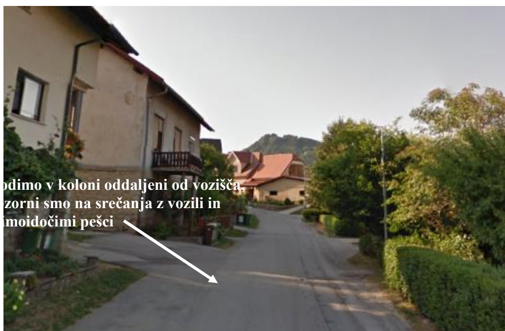
Slika 23: Neurejene površine za pešce na Trubarjevi ulici

Hodimo po pločniku. V primerih, ko ni pločnika, hodimo ob robu cestišča ob levem robu, tako da vidimo nasproti vozeča vozila. Cesto prečkamo na označenih prehodih za pešce. Preden prečkamo cesto, se prepričamo, da je prečkanje varno. Pogledamo levo, desno, in še enkrat levo. Kot pešci moramo biti v prometu dobro vidni. Pri hoji nosimo svetla oblačila in odsevnike. Pri prečkanju cest se prepričamo, da nas je voznik opazil. Cesto prečkamo šele takrat, ko v bližini ni vozil oziroma so se vozila ustavila pred prehodom za pešce.