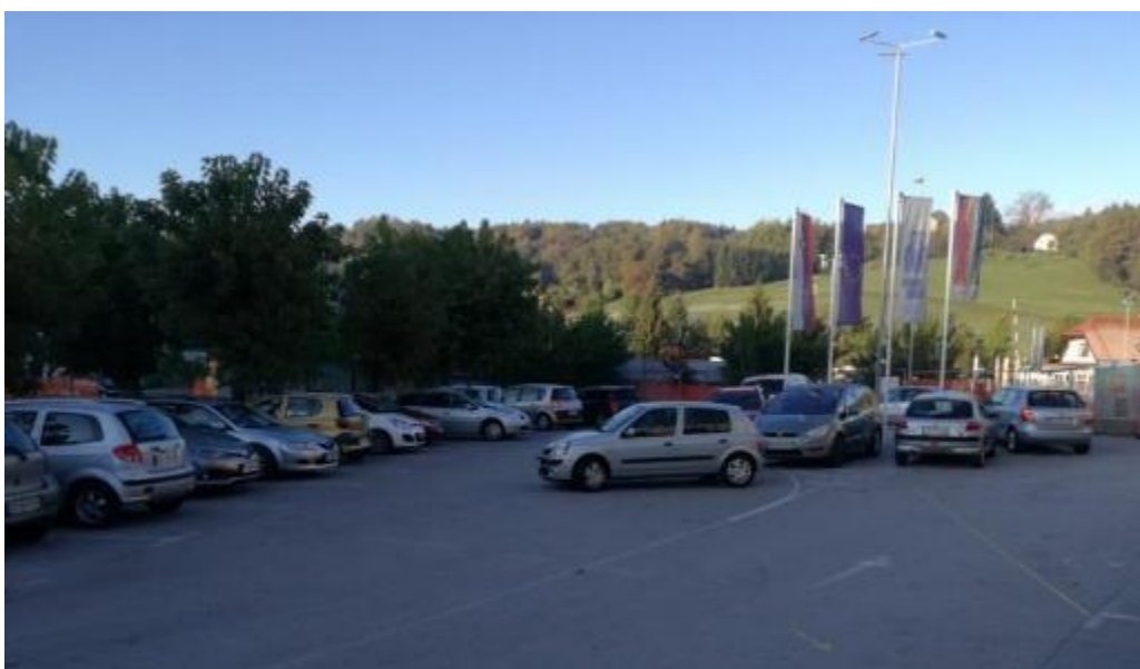
Slika 16: Parkirišče pri OŠ Franja Malgaja