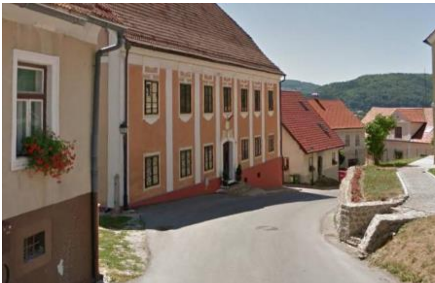
Slika 11: Ulica skladateljev Ipavcev