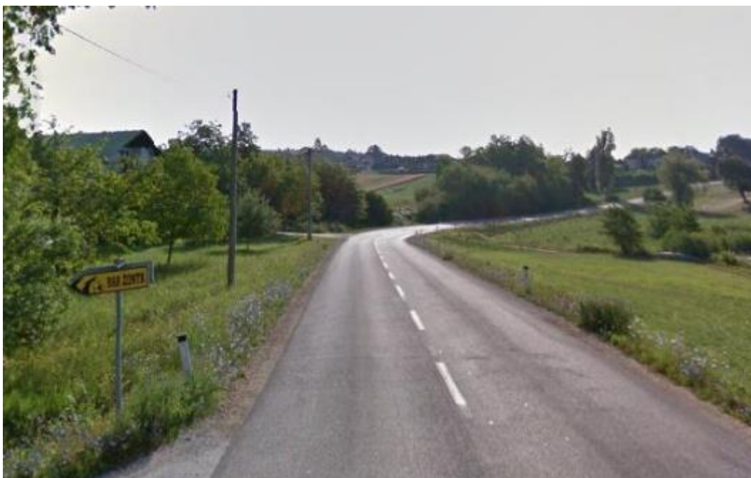
Slika 27: Cesta skozi Goričico brez urejenih površin za pešce