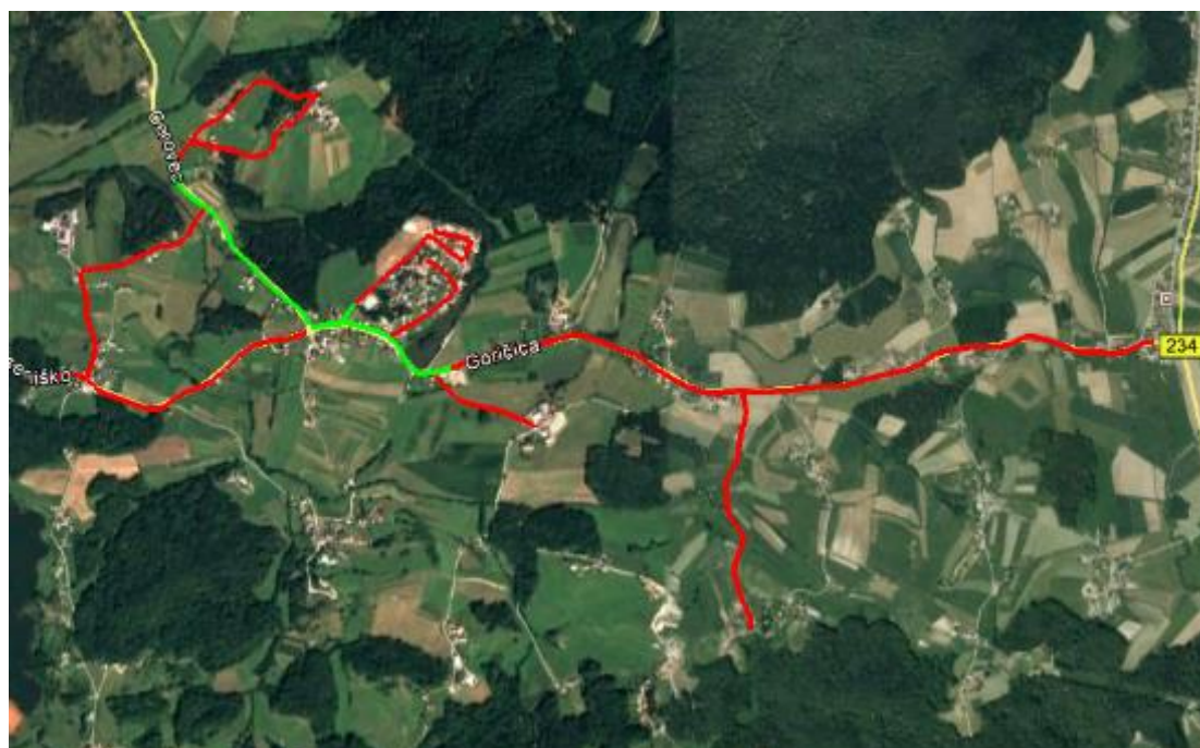
Slika 25: Prikaz šolskih poti POŠ Blagovna

V šolskem okolišu podružnične šole Blagovna se šolarji in ostali pešci srečujejo tako z urejenimi, kot tudi infrastrukturo neurejenimi odseki, kjer ob voziščih ne najdemo površin za pešce. V neposredni bližini šolskega poslopja so površine za pešce urejene. Hodnik za pešce neprekinjeno poteka od OŠ, skoraj do naselja Goričica. Na tem odseku so ustrezno urejeni tudi prehodi za pešce. Od krožnega križišča na Proseniškem do odcepa za Cerovec poteka nov hodnik za pešce. Na vseh preostalih cestnih odsekih ni urejenih površin za pešce.