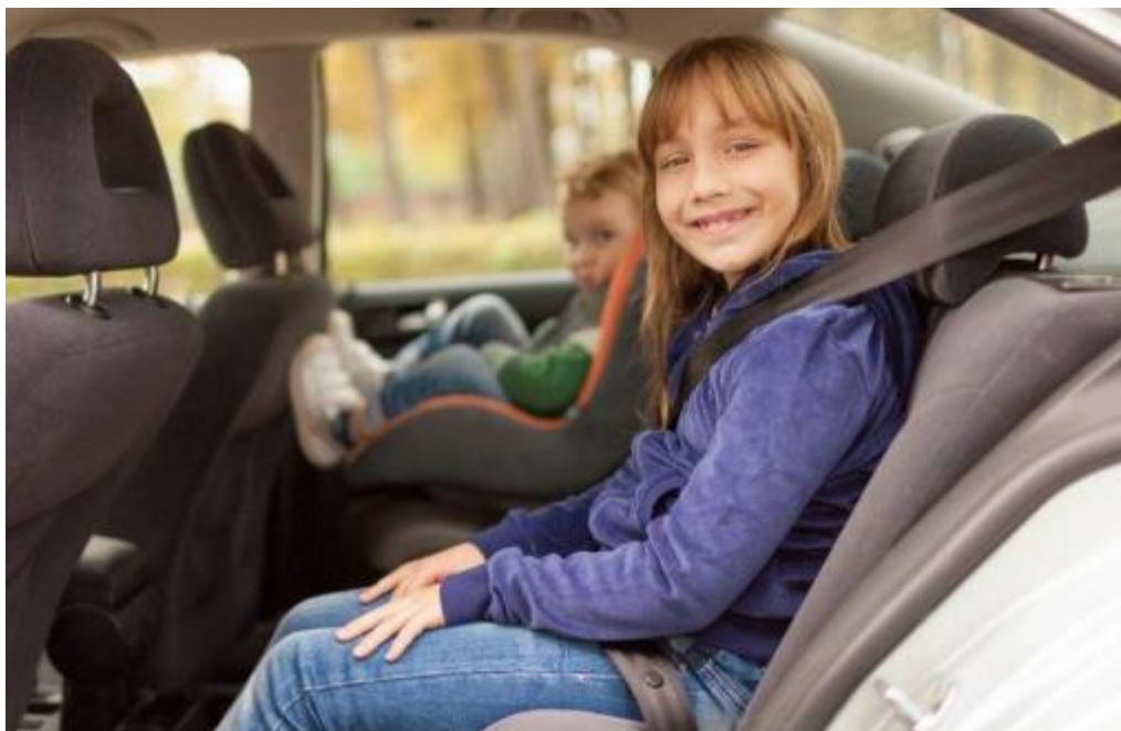
Slika 10: Šolar-potnik