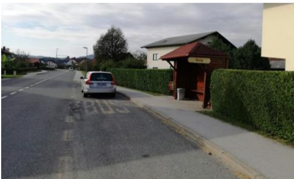
Slika 32: Obstoječe avtobusno postajališče v naselju Dole