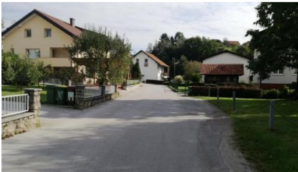
Slika 24: Neurejene površine za pešce

Na območjih, kjer ni urejenih površin za pešce, moramo biti še posebej pozorni. Spremljamo dogajanje na cesti, pri srečanju z vozili se jim čim bolj odmaknemo. Hodimo v koloni en za drugim.