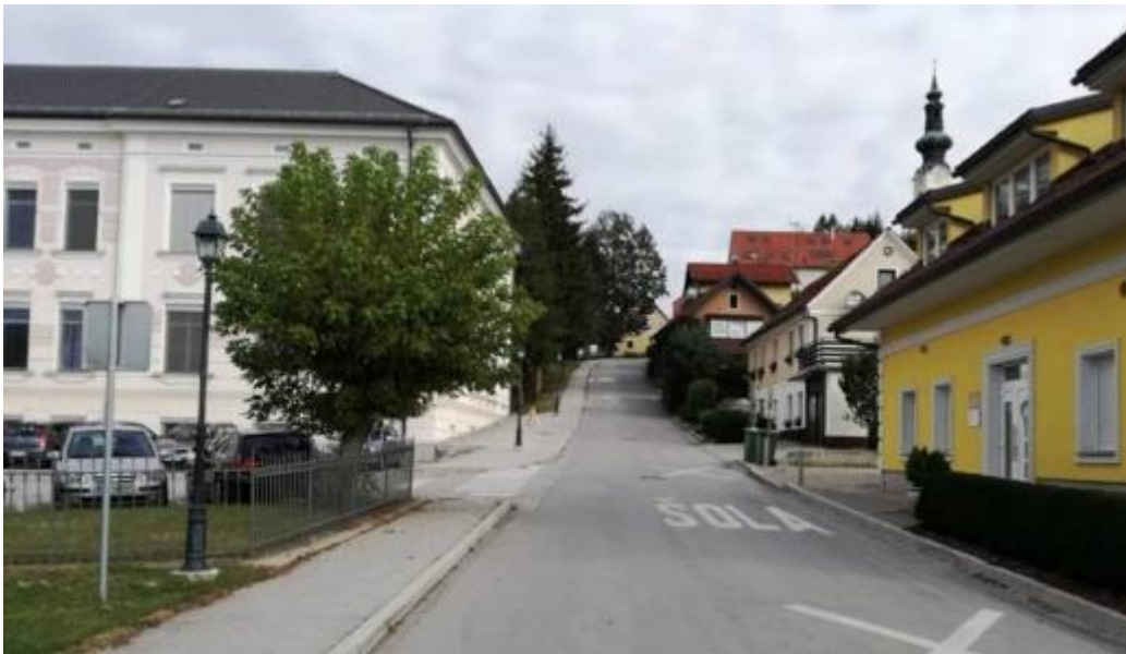
Slika 18: Urejene površine za pešce na šolskem območju-Ulica skladateljev Ipavcev

Na Ulici skladateljev Ipavcev, Dušana Kvedra in Cesti Miloša Zidanška, ki se nahajajo v bližini šole, so obstoječi hodniki za pešce in ustrezno izvedeni prehodi za pešce. Kljub urejeni infrastrukturi je potrebno biti vselej pozoren na dogajanje v prometu. Še posebej pozorni moramo biti pri prehajanju ceste. Preden stopimo na vozišče, se vedno prepričamo ali se nam približujejo vozila in, če lahko varno preidemo na drugo stran.