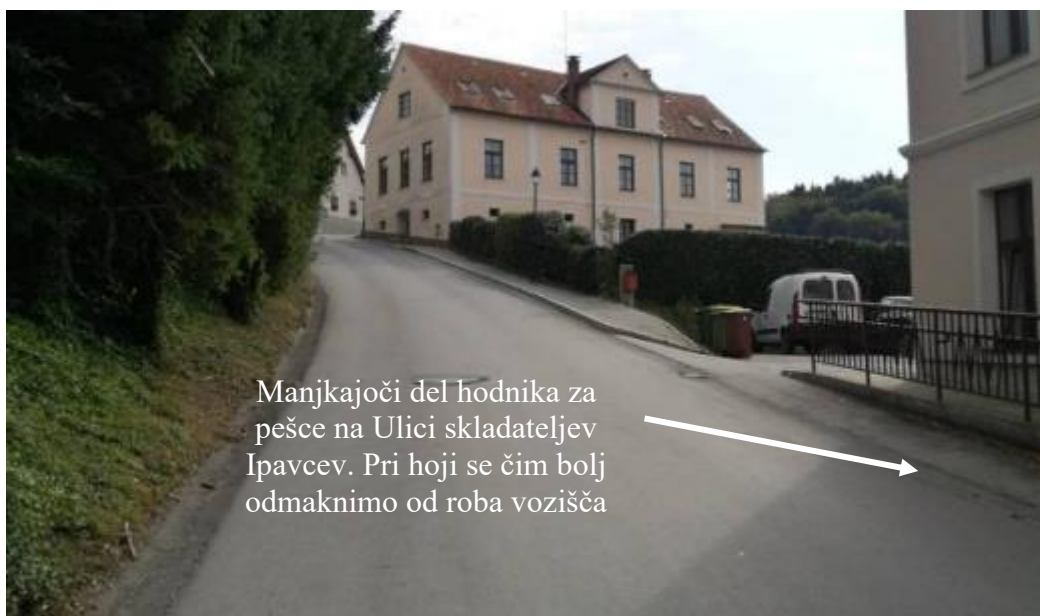
Slika 20: Ulica skladateljev Ipavcev

Na odsekih, kjer ni urejenih hodnikov za pešce, moramo hoditi ob levem robu vozišča v smeri hoje. Pomembno je, da se pri hoji čim bolj odmaknemo od samega vozišča. V primeru, da hodimo v skupini, je potrebno vedno hoditi v koloni en za drugim. Med hojo se ne prerivamo in ne lovimo. Pozorni smo na mimo vozeča vozila ter na srečanja z drugimi pešci.