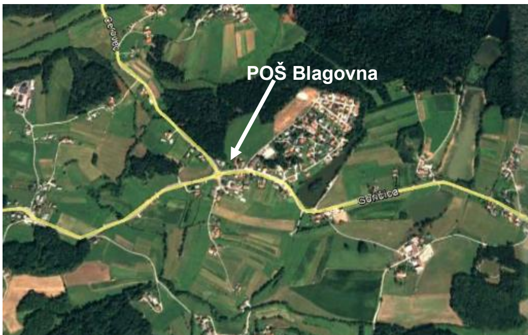
Slika 5: Pregledna situacija širšega šolskega okoliša POŠ Blagovna