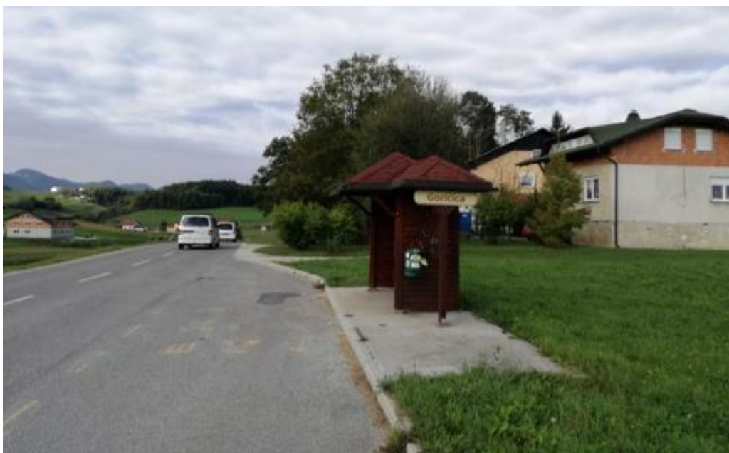
Slika 31: Obstoječe avtobusno postajališče v naselju Goričica