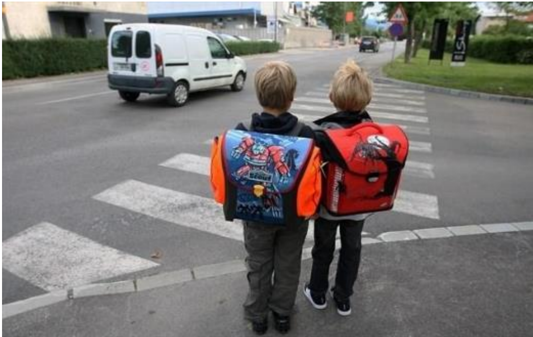
Slika 8: Šolar-pešec