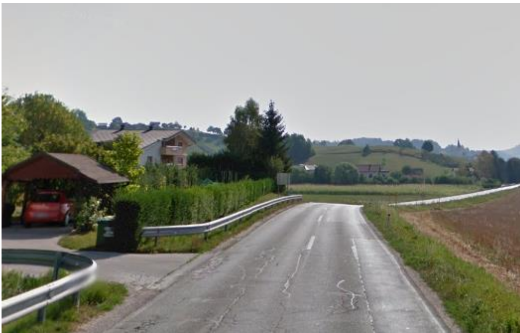
Slika 13: Cesta na kmetijsko šolo