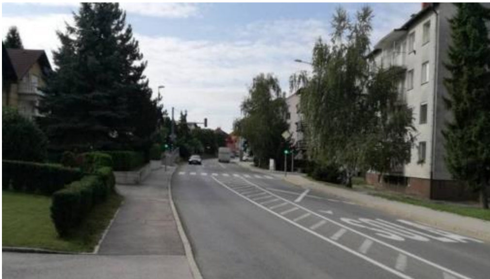
Slika 19: Na Cesti Miloša Zidanška in Ulici Dušana Kvedra so prometne površine pešcev ustrezno urejene

Na Ulici skladateljev Ipavcev, Dušana Kvedra in Cesti Miloša Zidanška, ki se nahajajo v bližini šole, so obstoječi hodniki za pešce in ustrezno izvedeni prehodi za pešce. Kljub urejeni infrastrukturi je potrebno biti vselej pozoren na dogajanje v prometu. Še posebej pozorni moramo biti pri prehajanju ceste. Preden stopimo na vozišče, se vedno prepričamo ali se nam približujejo vozila in, če lahko varno preidemo na drugo stran.