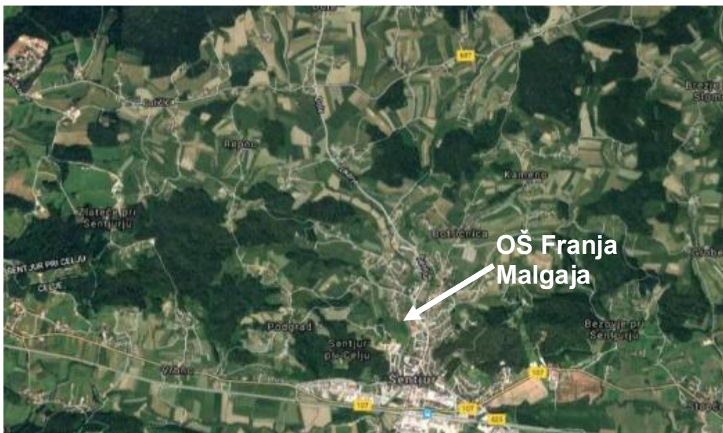
Slika 3: Pregledna situacija širšega šolskega okoliša OŠ Franja Malgaja