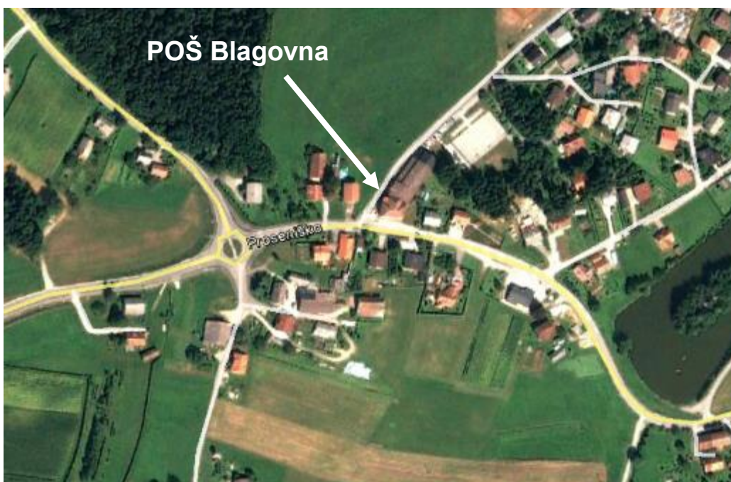
Slika 6: Pregledna situacija ožjega šolskega okoliša POŠ Blagovna