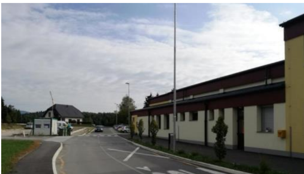
Slika 2: POŠ Blagovna