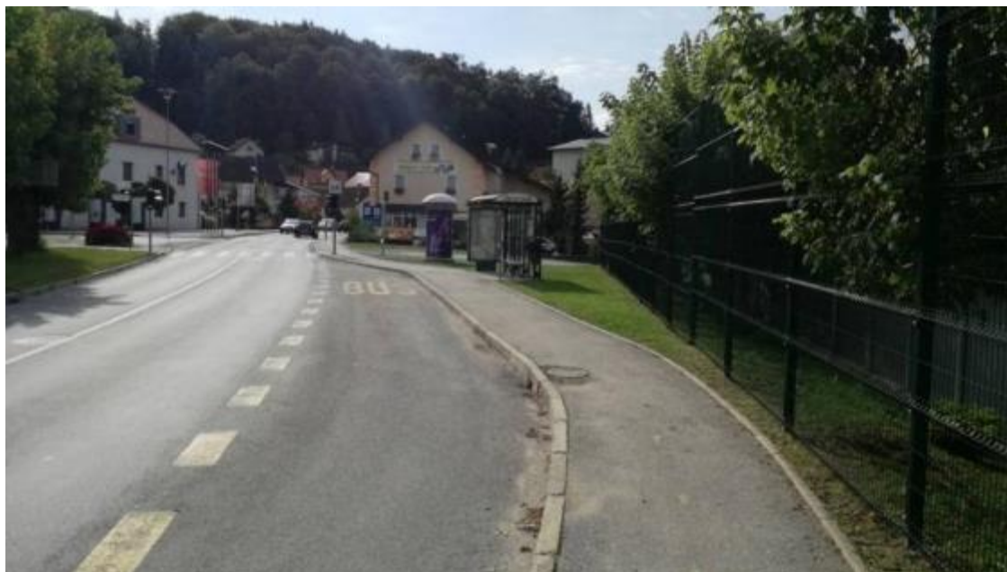
Slika 30: Obstojče avtobusno postajališče v bližini OŠ Franja Malgaja