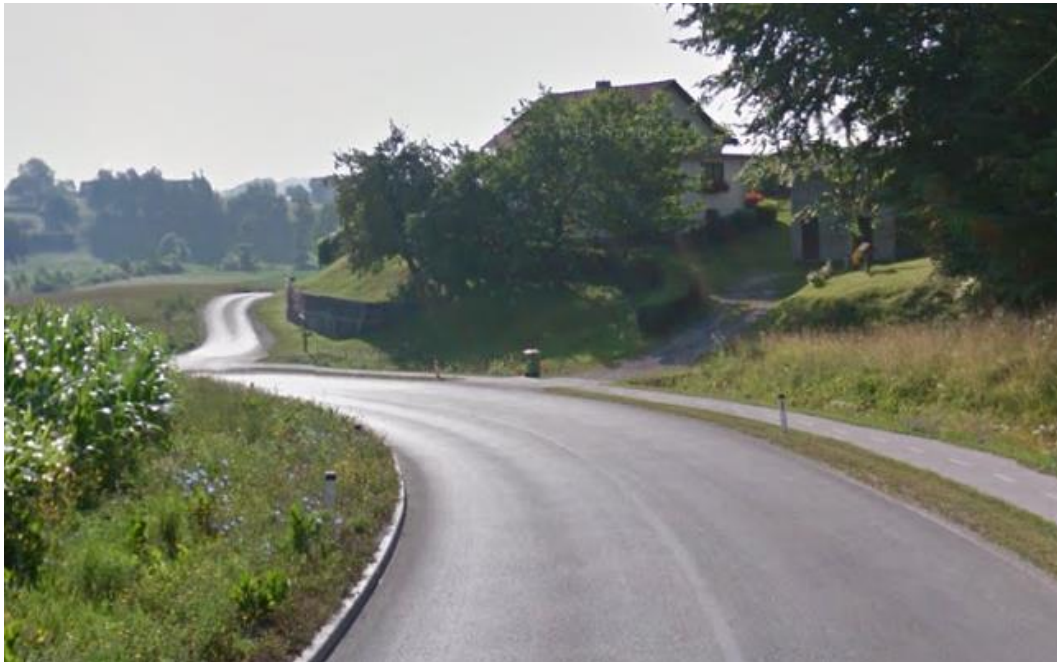
Slika 28: Dvosmerna kolesarska steza skozi Proseniško

Od krožnega križišča na Proseniškem do Bukovžlaka poteka urejena, dvosmerna kolesarska steza, ki omogoča varno in udobno kolesarjenje.