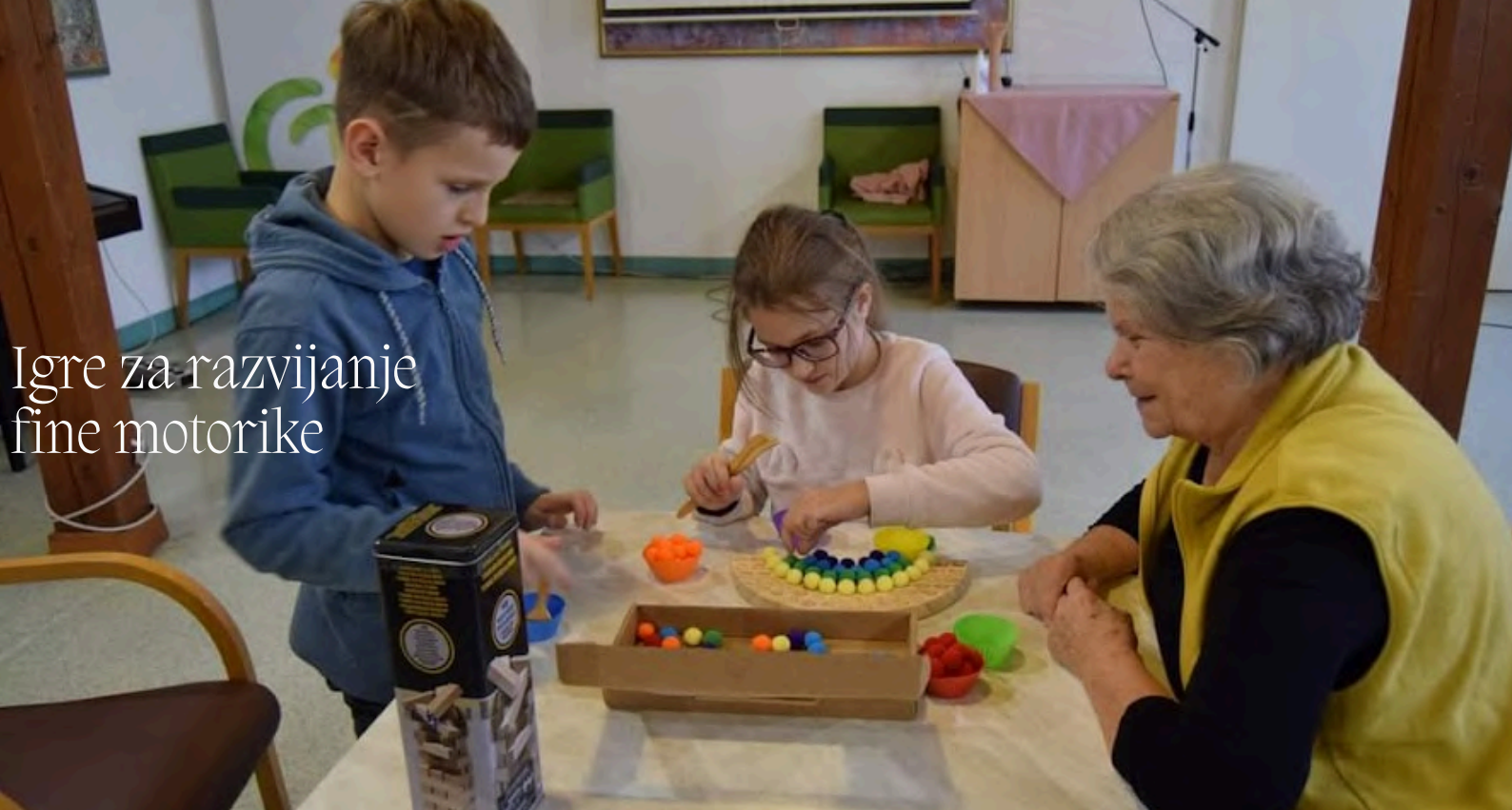
Igre za razvijanje fine motorike