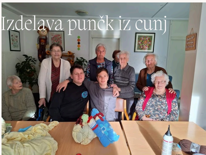
Izdelava punčk iz cunj