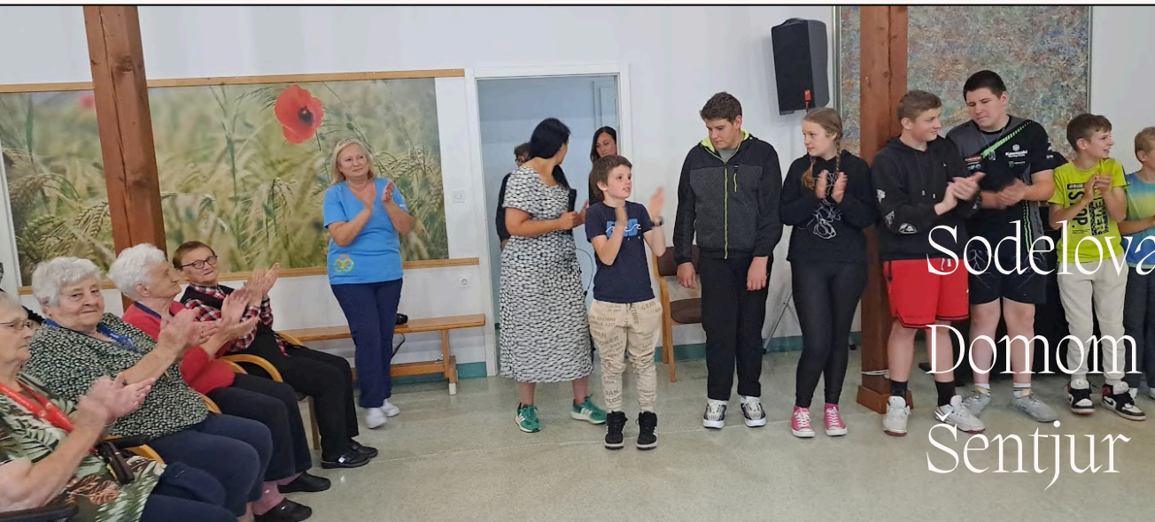
Sodelovanje z Domom starejših Šentjur

Učenci OPP smo se skozi vse leto mesečno družili s stanovalci doma. Še preden pa so se naši učenci podali na počitnice, so bila njihova prizadevanja usmerjena v to, da drug drugemu zagotovijo še nekaj prijetnih trenutkov, da lepo preživijo skupen čas, se družijo s stanovalci doma.